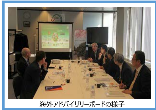
海外アドバイザーボードの様子